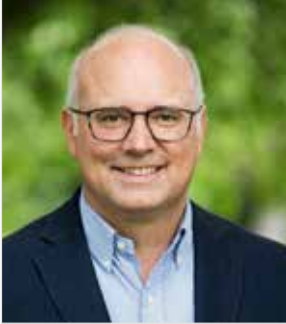
Jochen Weiler Bürgermeister