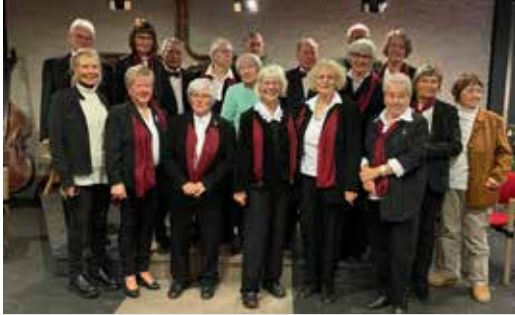
Unser Foto zeigt die Zupfmusikfreunde nach dem Konzert.

„Abendsegen“ war das diesjährige Adventkonzert der Zupfmusikfreunde Heimbach betitelt. Das berühmte Lied aus der Oper „Hänsel und Gretel“ von Engelbert Humperdinck, das mit den Zeilen beginnt „Abends, wenn ich schlafen geh, 14 Engel um mich stehn...“, war – wie der Vorsitzende des Vereins, Dieter Kremer, betonte – mit dem Wunsch verbunden, dass alle Kinder dieser Welt eine sichere und geborgene Schlafstätte finden mögen.