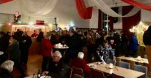
Unser Foto zeigt die festlich illuminierte Jugendhalle.

Mehr als 2.000 Euro Spenden beim Dämmerschoppen