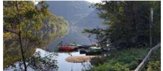
Bei der Präsentation der „Wasserstadt Heimbach“ steht auch der Stausee im Fokus.

Am 16. September werden die Schokoladenseiten der Stadt bei einer informativen Rundfahrt präsentiert – Den Abschluss bildet ein Open-Air-Jazz-Konzert am Wasserkraftwerk