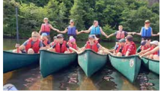
Der Kanuausflug im Staubecken Heimbach fand viel Anklang bei den Kids.