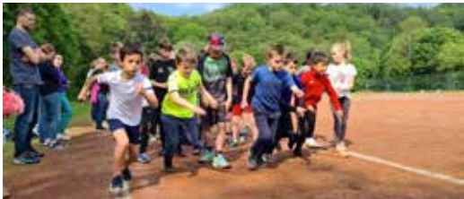
Startschuss zum Spendenlauf 2023

Allen lauffreudigen Schulkindern und freundlichen Spenderinnen und Spendern möchte ich herzlich danken. Das Geld geht je zur Hälfte an die Elterninitiative EKKK (Elterninitiative krebskranker Kinder St. Augustin e.V.) und an unseren Förderverein. Die Erlöse in Höhe von 256,37 €, die die Cafeteria beim Sportfest eingenommen hat, gehen komplett an die Elterninitiative.