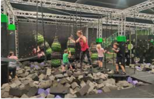
Die „Superfly“-Trampolinhalle in Aachen war eine der Ferien-Attraktionen.

Hoch in die Wipfel und hinaus auf den See Die Ferienspiele der Pfarrgemeinden Vlatten, Hergarten und Düttling boten den Kindern aufregende Abenteuer