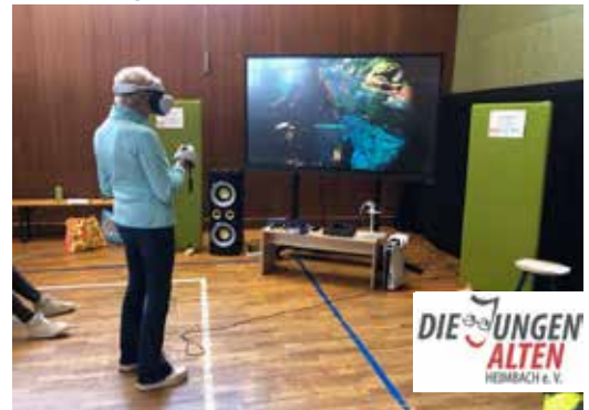
Auch die älteren Besucher wollten wissen, was die „Virtuelle Realität“ zu bieten hat.