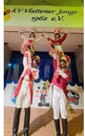
Hoch hinaus: Die Tanzgruppen zeigten ihr Können in Vlatten.